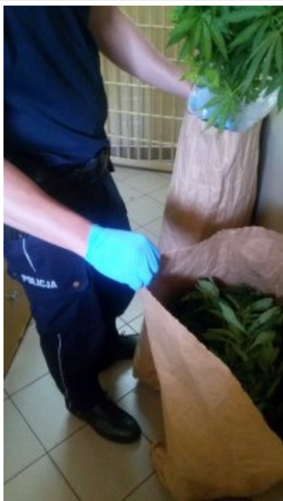
Policjant prezentujący zabezpieczone krzaki konopi

19 maja 2016 roku policjanci z Wydziału do Walki z Przeszecznością Narkotykową KWP w Łodzi przyjechali pod wytypowany wcześniej adres we wsi w gminie Biała Rawska, gdzie mogło dochodzić do nielegalnej uprawy konopi indyjskich. Na miejscu, w tunelu foliowym przeznaczonym do uprawy warzyw ujawnili rośliny konopi. Powiadomili o tym policjantów z Białej Rawskiej, którzy z funkcjonariuszami z Łodzi wspólnie prowadzili dalsze działania. W trakcie przeszukania funkcjonariusze ujawnili 9 sztuk krzaków konopi indyjskich, 277 gramów suszu roślinnego, ziarna konopi oraz sprzęt służący do uprawy taki jak lampy sodowe, szafę i wentylator. Właściciel plantacji, 25-letni mieszkaniec gminy Biała Rawska, został zatrzymany w policyjnym areszcie. Odpowie za posiadanie środków odurzających oraz uprawę konopi, za co grozi kara do 3 lat pozbawienia wolności. O jego dalszym losie zadecyduje prokurator.